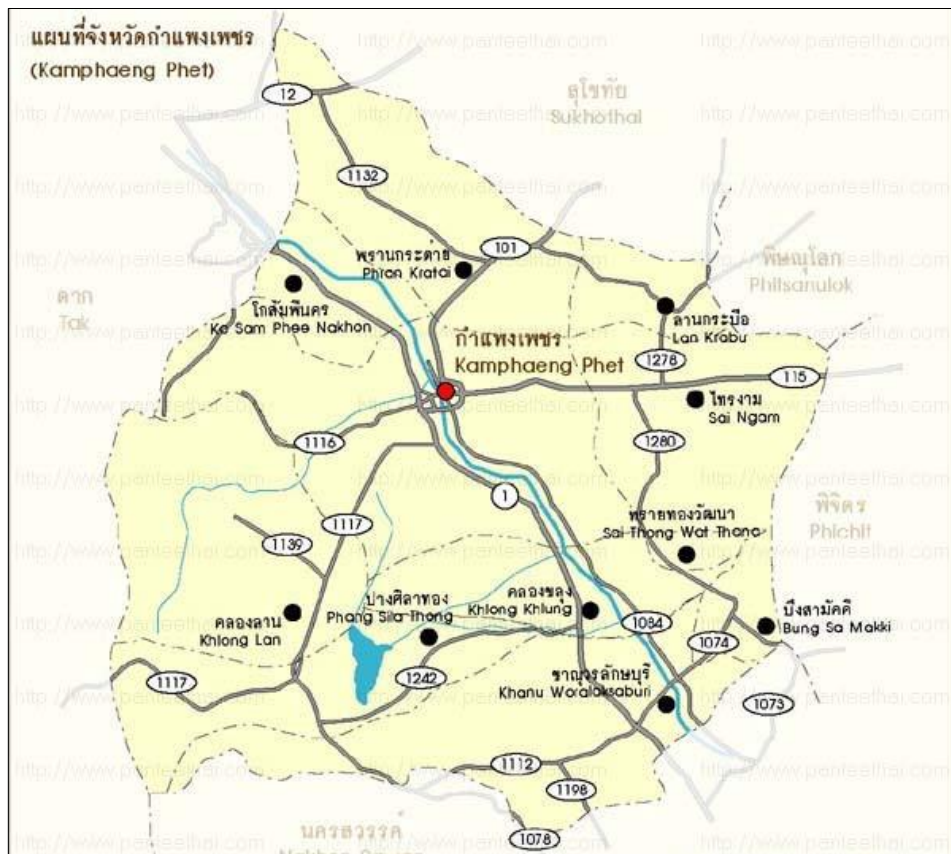
ภาพที่ 1 แผนที่จังหวัดกำแพงเพชร

โดยสรุป ลักษณะพื้นที่ของจังหวัดกำแพงเพชร ด้านตะวันตกเป็นภูเขาสูงลาดลงมาทางด้านตะวันออก ลักษณะดินเป็นดินปนทรายเหมาะแก่การทำนาและปลูกพืชไร่