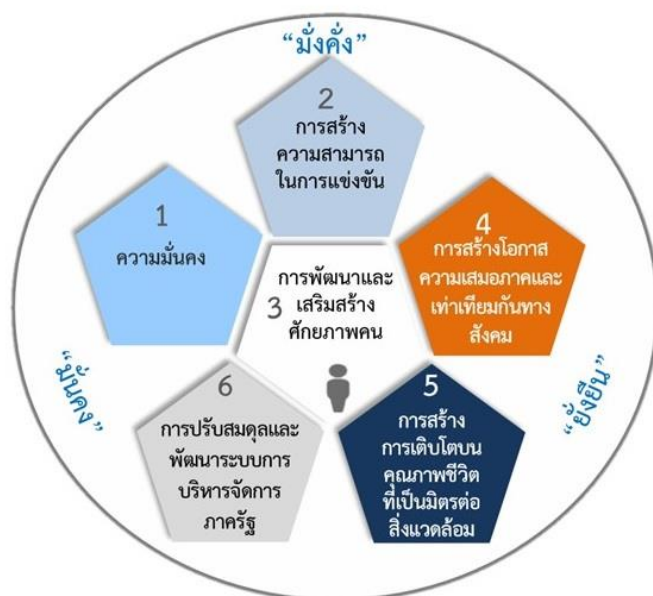
ภาพที่ 1 กรอบแนวทางการพัฒนาในระยะ 20 ปี